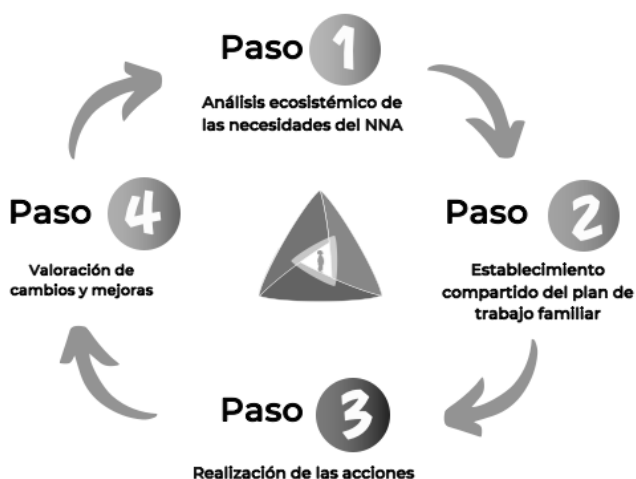
Figura 2: El ciclo del Triángulo P+