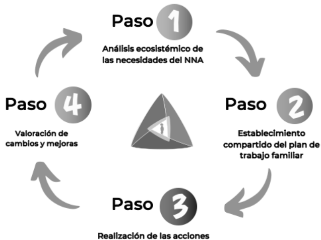
Figura 2: El ciclo del Triángulo P+